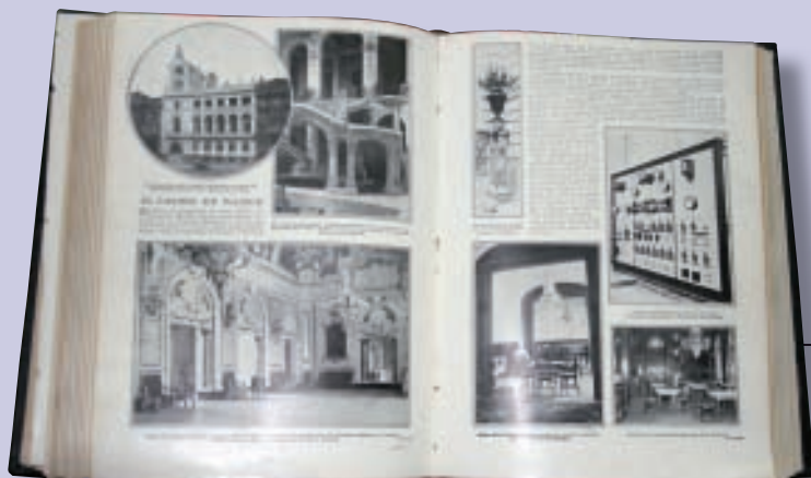
Doble página dedicada al Casino con motivo de la inauguración de la nueva sede. Junto a las fotografías se comentan aspectos técnicos y ornamentales del nuevo edificio.

Blanco y negro, n° 1.012 (02 de octubre de 1910), pp. 10-11.