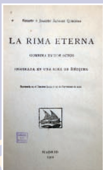
1ª edición de La rima eterna obra de los hermanos Álvarez Quintero escrita para homenajear a Gustavo Adolfo Bécquer.

El escritor Felipe Trigo se da de alta en 1910. Ese mismo año, el exitoso novelista publica La clave . Recordemos que de las obras de Trigo se hacían tiradas que no bajaban de los 10.000 ejemplares, ello es una muestra del inmenso éxito del escritor.