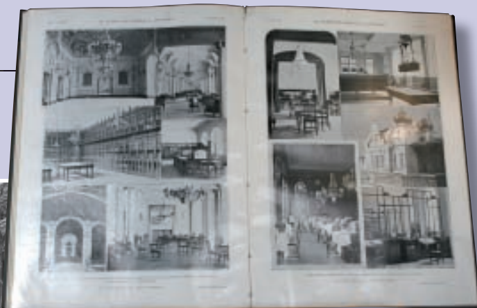
Espectacular doble página de La Ilustración Española y Americana con fotografías de las diferentes estancias del Casino.

Blanco y negro, n° 1.012 (02 de octubre de 1910), pp. 10-11.