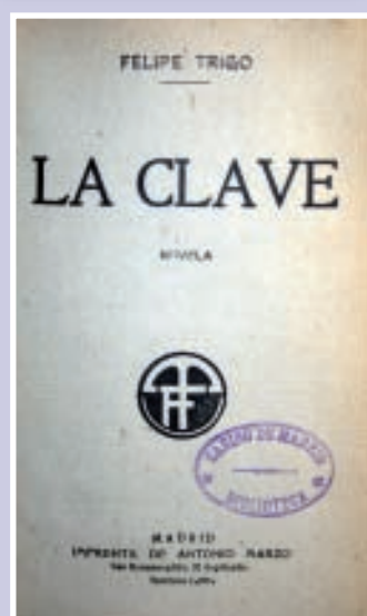
1ª edición de la novela de Felipe Trigo La clave .