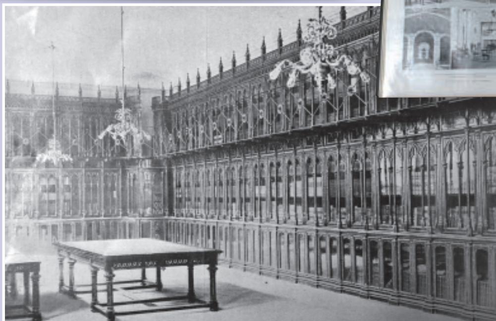
Biblioteca neo-gótica del Casino construida en hierro por la cerrajería Asins. Esta fotografía apareció en 1910 La Ilustración Española y Americana.

La sede anterior en el edificio de la Equitativa ya disponía de una hermosa biblioteca. Ahora se trataba de aprovechar esos estantes en la nueva biblioteca ampliándolos y siguiendo el estilo neo-gótico original. De ello se encargó la prestigiosa cerrajería Asins. El material elegido fue el hierro, pues era el material idóneo para luchar contra el fuego. Recordemos que aún quedaba en la memoria de todos el desastroso incendio de la biblioteca del Congreso de Estados Unidos acaecido en 1851. (Da Rocha, 2003: pp 153-158)