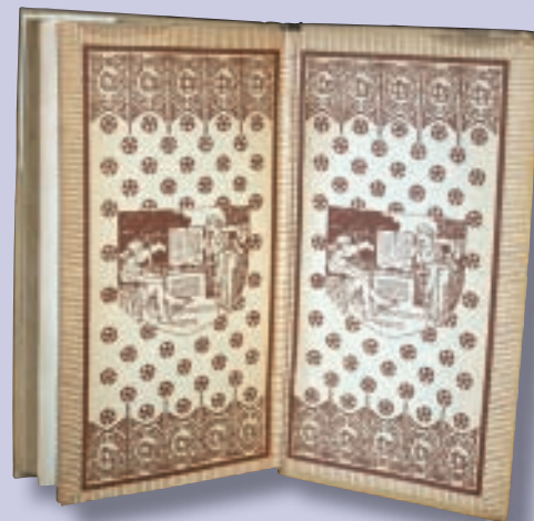
Interior de la cubierta de Las cerezas del cementerio de Gabriel. Otra 1ª edición en nuestra biblioteca