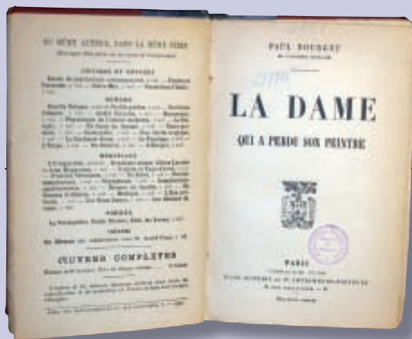
Un ejemplo del importante fondo francés de la Biblioteca del Casino. Se trata de la 1ª edición de La dame qui a perdu son peintre de Paul Bourget.