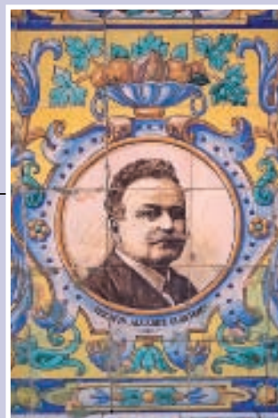
Los hermanos Álvarez Quintero también fueron socios de nuestra institución.