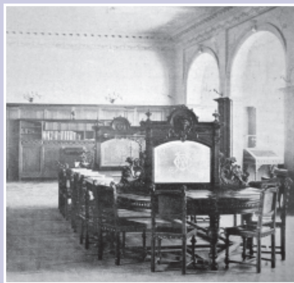
Sala de lectura de estilo inglés y con muebles de roble. Esta fotografía apareció en 1910 La Ilustración Española y Americana.

Pérez Galdós, igualmente en 1910, publica Amadeo I . Se trata de una obra que pertenece a la serie final de sus Episodios Nacionales . Nuestra biblioteca dispone de la primera edición y es muy interesante observar el cuidado que ponía el novelista en sus publicaciones. Para ennoblecer sus ediciones encargó el diseño de una esfinge a Arturo Mérida y llegaron a hacerse dos versiones del dibujo. La primera apareció cuando Galdós publicaba con la editorial La Guirnalda. La segunda, cuando el novelista recuperó el control de su obra y decidió auto publicarse. Esta segunda versión moderniza a la primera "con un busto y una cara de mujer contemporánea,